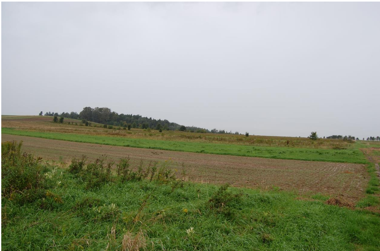
Fragment terenu inwestycyjnego Kompleks w Grodzisku Dolnym