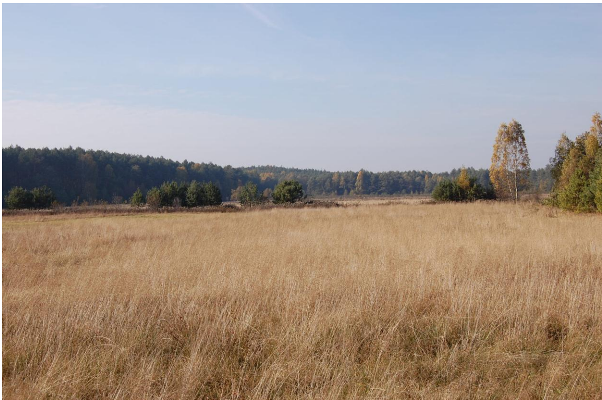
Fragment terenu „Malne”