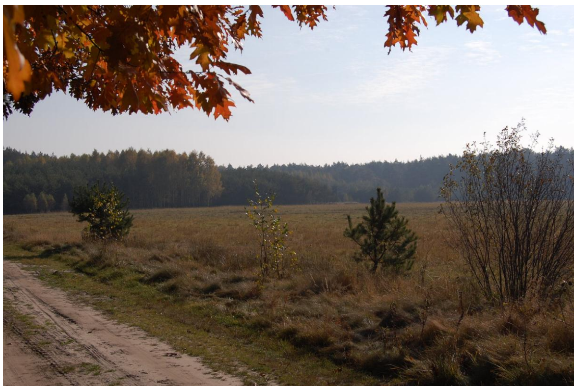
Fragment terenu „Malne”